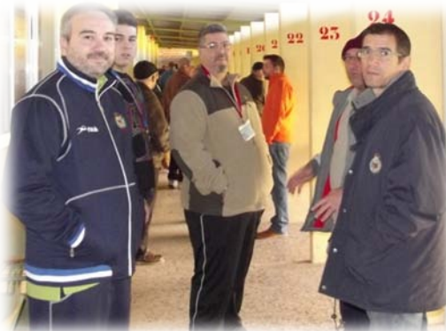
Imágenes de la cancha de tiro "A" y "B" durante la tirada sorpresa y los duelos de avancarga.