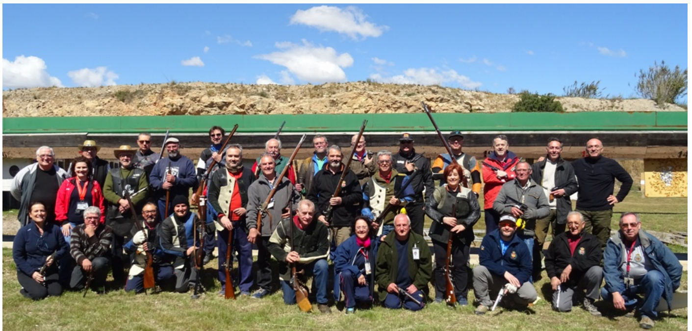
La foto de grupo en la que nos faltan algunos participantes, entre ellos la escuadra completa del club Cambrils.