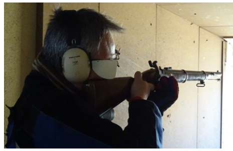
Instantáneas de algunos participantes durante la fase de toma de puntería y/o disparo.