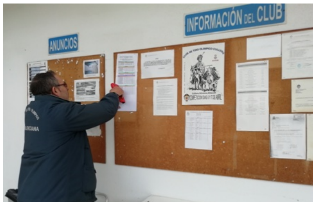
El sábado fue una jornada tranquila.