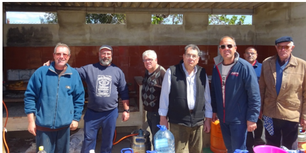
El presidente del CTO Cullera y el concejal de deportes con los encargados de cocinar las paellas con arroz de la misma ciudad.