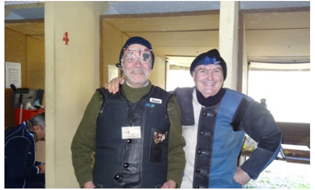
Instantáneas de algunos momentos de la competición.

El sábado, primer día de competición amaneció con alguna nube y un viento que en ocasiones fue molesto hasta el mediodía que cayó un fuerte chaparrón. No hizo frío, pero el ambiente era fresco, claro que para un valenciano de la costa 17° con brisa lo consideramos frío.