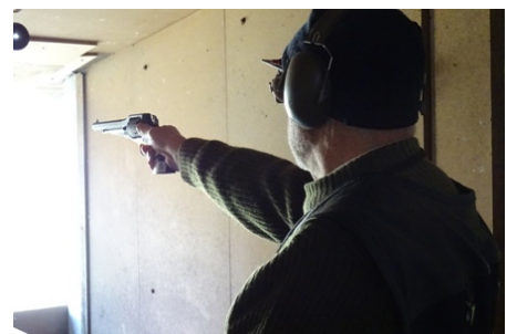
Instantáneas de algunos participantes durante la fase de toma de puntería y/o disparo.