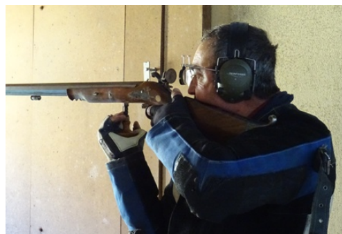
Instantáneas de algunos participantes durante la fase de toma de puntería y/o disparo.